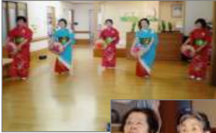
踊りサークル 「なかよし会」 息の合った踊り