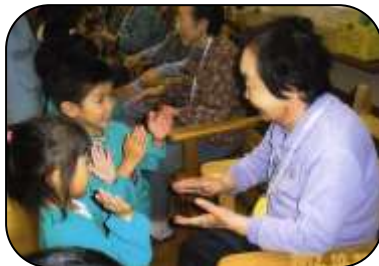
吉島保育園 の子供達 園児と一緒に。 思わず、笑みが!!