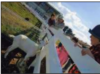
新川牧場へピクニック