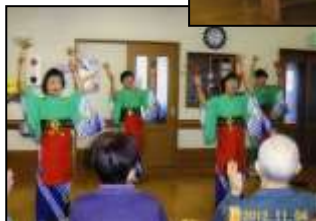
なかよし会の 踊り