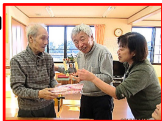
11月14日 誕生日 お茶とケーキでお祝いしました