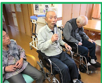
11月12日 カラオケ 演歌は得意です！！