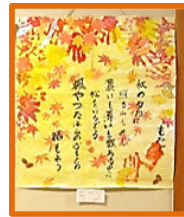
11月10日 飯野地区の公民館祭り 紅葉の貼り絵と紙切り飾りを出品しました