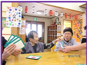
11月2日 トランプ ばば抜き「ばばを取らないように…」なかなか、頭をつかいます

第128号 平成30年12月発行 NPO法人アットホーム新川 デイサービス金さん銀さん 〒939-0675 富山県入善町東狐603 TEL (0765)72-0095 FAX (0765)72-0096 http://www.at-home.or.jp/