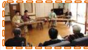
1月23日 琴と尺八と踊りに感激 弥生の会の皆様と楽しく歓談!