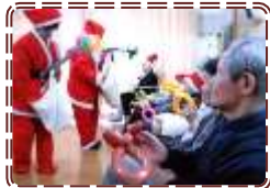
12月24日 クリスマス会 くさぶえ乙女さんのバルーンアート