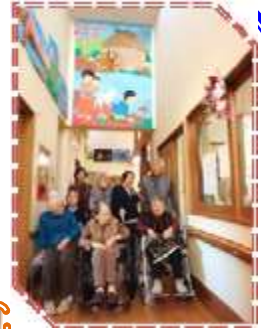
1月16日 はり絵大作完成! 3ヶ月の力作です