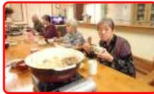
1月6日 すき焼きで新年会