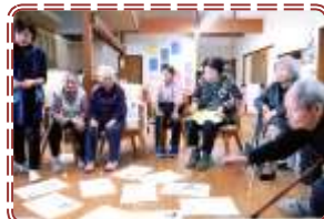
1月3日 初ゲーム大会 恒例大カルタ 1番はだ〜れ