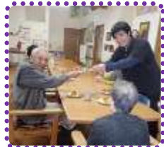
12月15日 男の気持ちを入れて!