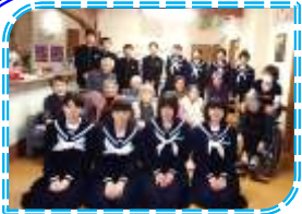
11月14日 滑川中のボランティア来訪