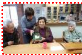
1月15日 皆でお祝い♥ ハートを入れて