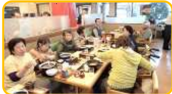
11月27日 寒い中をラーメン食べに外出