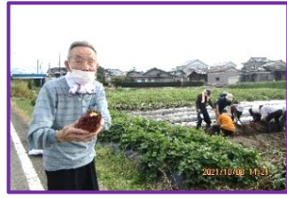
大きなさつま芋が とれました