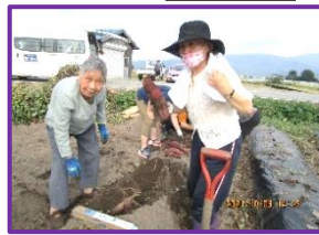
毎年恒例の芋掘りへ行ってきました