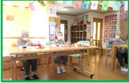
タンバリンを叩いて歌いました 10月7日 音レク

第163号 令和3年11月発行 NPO法人アットホーム新川 デイサービス金さん銀さん 〒939-0675 富山県入善町東狐603 TEL (0765)72-0095 FAX (0765)72-0096 http://www.at-home.or.jp/