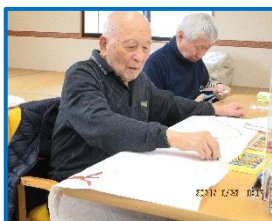
景色の空の色塗りを 真剣にされました