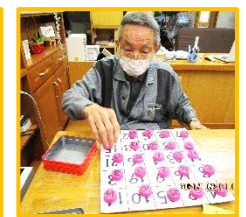
彼岸花をきれいに 切っておられます