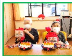
おめでとうございます！