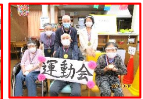
みなさん。ステキな笑顔！