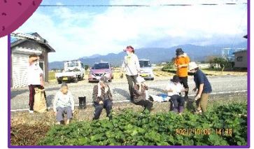
皆さん張り切って掘られました