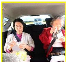
ドライブ先で おやつに食べ ました