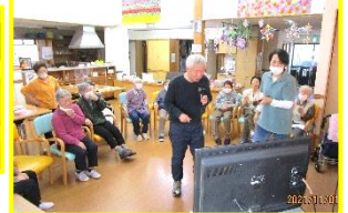
久しぶりにマイクを片手に歌いました