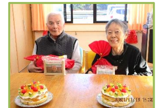
プレゼントを受け取り 笑顔です