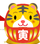
虎と赤富士 の貼り絵を しています